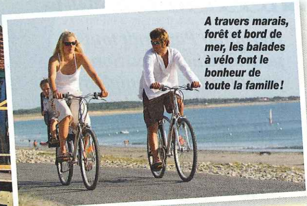
A travers marais, forêt et bord de mer, les balades à vélo font le bonheur de toute la famille!